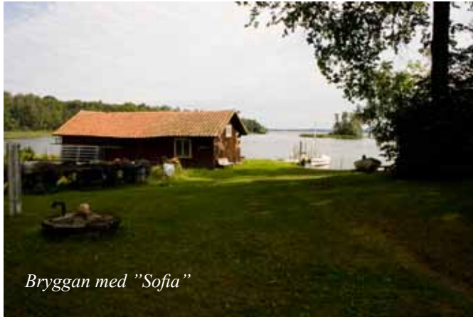
Bryggan med "Sofia"