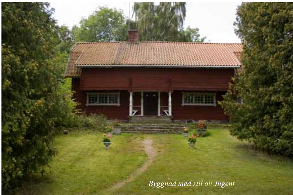
Byggnad med stil av Jugent

Efter en natt i Vinöns gästhamn blir jag bogserad ut och kan styra österut mot Fiskeboda. På vägen dit stannar jag och tar lunch på Tåkenön, som har använts som fäbodvall av Julita gård.