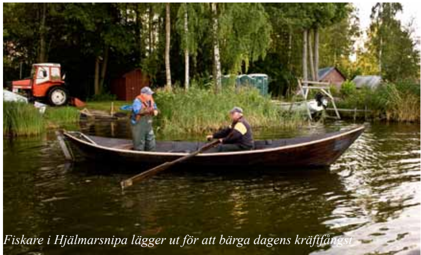
Fiskare i Hjälmarsnipa lägger ut för att bärga dagens kräftfångst

Morgonen blir klar och utan vind. vi vrickar ut längs revet i riktning mot Valen. De tunna landtungorna är fågelreservat och vi kan inte gå iland.